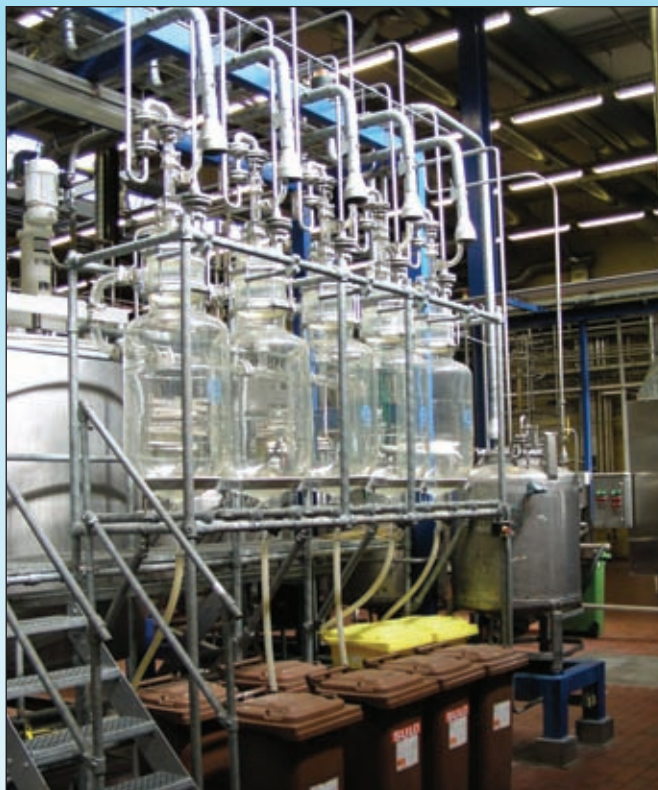
HPLC (High Performance Liquid Chromatografie) ten behoeve van scheidingsprocessen.